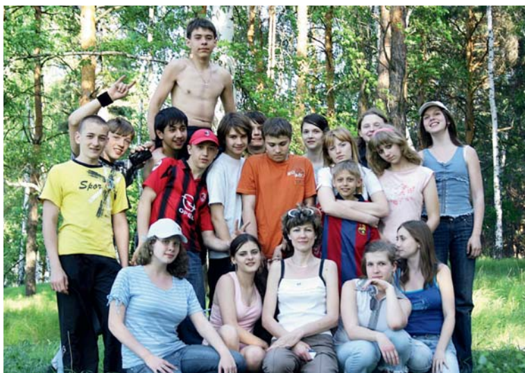
Пикник на природе пользуется у ребят и их наставников заслуженной популярностью

ВСЕМИРНОЙ ОРГАНИЗАЦИЕЙ ЗДРАВООХРАНЕНИЯ СОЦИАЛЬНОЕ БЛАГОПОЛУЧИЕ ОПРЕДЕЛЯЕТСЯ КАК ГАРМОНИЧНОЕ СОЧЕТАНИЕ СОЦИАЛЬНОГО, ФИЗИЧЕСКОГО, ИНТЕЛЛЕКТУАЛЬНОГО, ЭМОЦИОНАЛЬНОГО И ДУХОВНОГО АСПЕКТОВ ЖИЗНИ ЧЕЛОВЕКА И ЯВЛЯЕТСЯ НЕОТЪЕМЛЕМОЙ ЧАСТЬЮ ОБЩЕГО ПОНЯТИЯ ЗДОРОВЬЯ.