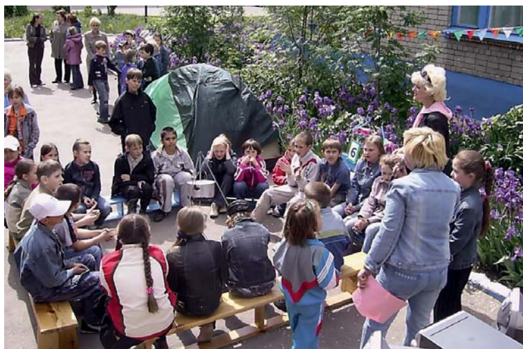
Последнее напутствие перед походом

МОЛОДАЯ СЕМЬЯ – СЕМЬЯ В ПЕРВЫЕ ТРИ ГОДА ПОСЛЕ ЗАКЛЮЧЕНИЯ БРАКА (В СЛУЧАЕ РОЖДЕНИЯ ДЕТЕЙ – БЕЗ ОГРАНИЧЕНИЯ ПРОДОЛЖИТЕЛЬНОСТИ БРАКА) ПРИ УСЛОВИИ, ЕСЛИ ОДИН ИЗ СУПРУГОВ НЕ ДОСТИГ 30-ЛЕТНЕГО ВОЗРАСТА, А ТАКЖЕ НЕПОЛНЫЕ СЕМЬИ С ДЕТЬМИ, В КОТОРЫХ МАТЬ ИЛИ ОТЕЦ НЕ ДОСТИГЛИ 30-ЛЕТНЕГО ВОЗРАСТА.