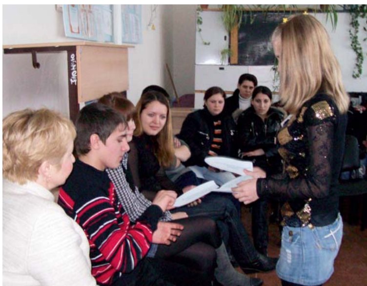
Занятия с волонтерами проходят в форме тренингов

В настоящее время продолжается работа по подготовке и организации информационно-профилактических тренингов со сверстниками. Проведены занятия: «Давайте поделимся знаниями», «Поговорим о наркотиках», «ВИЧ и закон». Проведены мероприятия для условно осужденных подростков «Что такое любовь?», открытое занятие «Твои знания» для студентов профессионального лицея, «Хотим поделиться» для студентов Красноармейского филиала Московской Академии народного хозяйства. Всего с начала года в мероприятиях, проводимых командой волонтеров, приняло участие более 100 подростков.