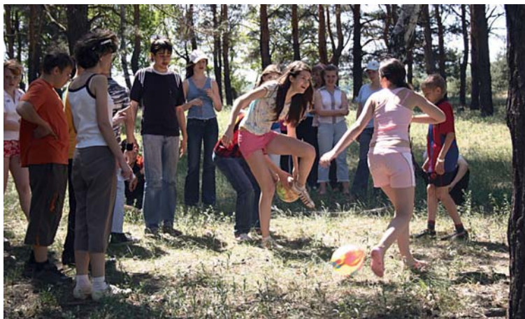
Занятия спортом укрепляют и дух, и тело

Было отмечено, что эффективное взаимодействие учреждений системы профилактики, применение инновационных форм и методик в работе с неблагополучными семьями помогают добиться реальных положительных результатов.