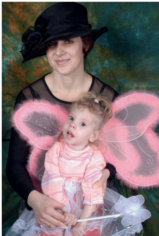
Профессионализм фотохудожника помог раскрыть индивидуальность каждого ребенка