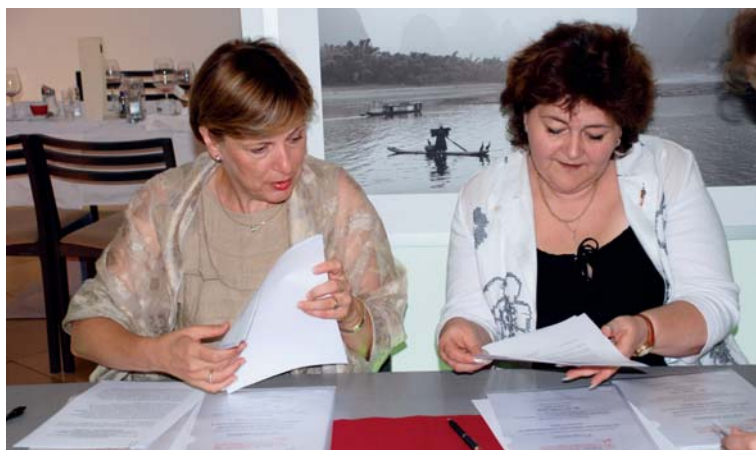
Подписание соглашения о проведении в Саратове 14-го заседания российско-австрийской рабочей группы

ОЧЕРЕДНОЕ, 14-Е ЗАСЕДАНИЕ РОССИЙСКО-АВСТРИЙСКОЙ РАБОЧЕЙ ГРУППЫ ПО ВЗАИМОДЕЙСТВИЮ В СОЦИАЛЬНОЙ СФЕРЕ БУДЕТ ПОСВЯЩЕНО ВОПРОСАМ ПРОФИЛАКТИКИ СЕМЕЙНОГО НАСИЛИЯ. РАБОЧАЯ ГРУППА БЫЛА СОЗДАНА В 1999 ГОДУ В СОСТАВЕ СМЕШАННОЙ РОССИЙСКО-АВСТРИЙСКОЙ КОМИССИИ ПО ТОРГОВЛЕ И ЭКОНОМИЧЕСКОМУ РАЗВИТИЮ. ЕЕ ОСНОВНАЯ ЗАДАЧА – ДВУХСТОРОННИЙ ОБМЕН ОПЫТОМ В СФЕРЕ СОЦИАЛЬНОЙ ЗАЩИТЫ НАСЕЛЕНИЯ И КАК РЕЗУЛЬТАТ – ПОВЫШЕНИЕ ДОСТУПНОСТИ И КАЧЕСТВА ОКАЗЫВАЕМЫХ СОЦИАЛЬНЫХ УСЛУГ ДЛЯ УЯЗВИМЫХ ГРУПП НАСЕЛЕНИЯ. С РОССИЙСКОЙ СТОРОНЫ В СОСТАВ ГРУППЫ ВХОДЯТ ПРЕДСТАВИТЕЛИ ОРГАНОВ СОЦИАЛЬНОЙ ЗАЩИТЫ НАСЕЛЕНИЯ 13 СУБЪЕКТОВ РОССИЙСКОЙ ФЕДЕРАЦИИ.