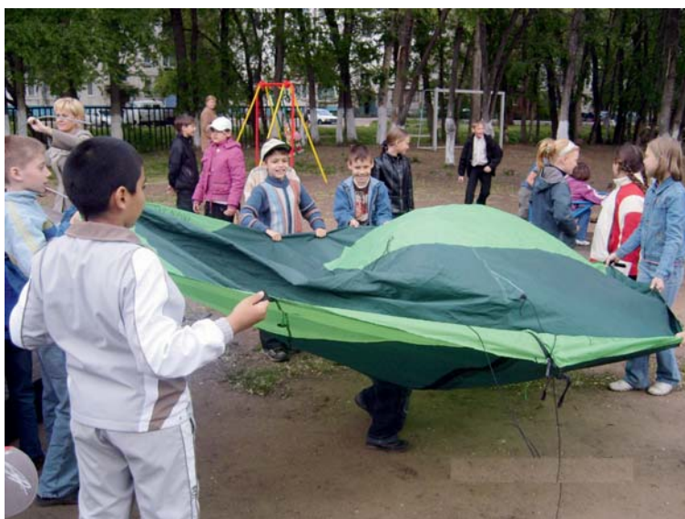
Учимся ставить палатку

Т акой отдых укрепляет и сплачивает семью, учит поддержке, терпимости и вниманию по отношению друг к другу. Представители разных поколений оказываются включенными в общее действие, ощущают свою необходимость и значимость в достижении совместной цели. Вот дочка помогает маме и бабушке кашеварить у костра, чтобы затем накормить всех необычайно вкусным супом или кашей. А сын с отцом устанавливают палатку, готовя уютный ночлег. Так рождается духовный контакт между поколениями, дети, подростки начинают острее и многограннее воспринимать красоту окружающего мира, у них развиваются положительные нравственные качества, любознательность, бережное отношение к природе, расширяется кругозор, формируются представления об истории родного края, традициях и культуре своего народа. Кроме того, туризм – прекрасная возможность поправить свое здоровье. В процессе отдыха на природе происходит комплексное воздействие на организм человека многих природных факторов – солнца, воздуха, воды – и разнообразной двигательной активности. Развитие семейного туризма стало возможным благодаря реализации областной целе-