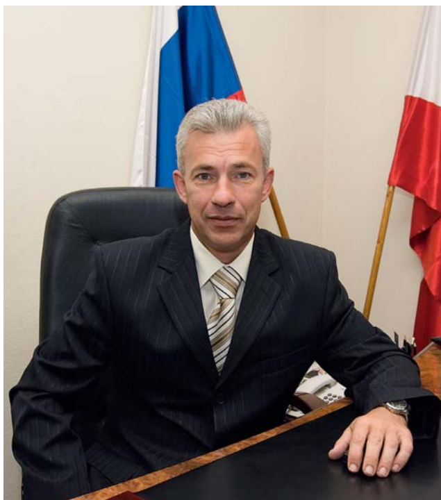
В.В. Чернышев, министр социального развития Саратовской области

ОСНОВНОЙ ЗАДАЧЕЙ ЛЮБОГО ГОСУДАРСТВА ЯВЛЯЕТСЯ СОЗДАНИЕ УСЛОВИЙ ДЛЯ МАКСИМАЛЬНОЙ САМОРЕАЛИЗАЦИИ ЧЕЛОВЕКА КАК ЛИЧНОСТИ, РАСКРЫТИЕ ВСЕХ ЕГО ПОТЕНЦИАЛОВ. НО НА ТЕРРИТОРИИ ГОСУДАРСТВА ПРОЖИВАЮТ ЛЮДИ РАЗНОГО ВОЗРАСТА, ПОЛА, НАЦИОНАЛЬНОСТИ, И У КАЖДОЙ ИЗ ЭТИХ КАТЕГОРИЙ СВОИ ПОТРЕБНОСТИ, СВОИ ЖИЗНЕННЫЕ ПРИОРИТЕТЫ И ЦЕЛИ. ПРОВЕДЕНИЕ ТЕМАТИЧЕСКИХ ГОДОВ ПОЗВОЛЯЕТ В КАКОМ-ТО КОНКРЕТНО ВЗЯТОМ ПЕРИОДЕ СКОНЦЕНТРИРОВАТЬ НАУЧНЫЕ, ОБЩЕСТВЕННЫЕ, ГОСУДАРСТВЕННЫЕ СИЛЫ НА ВЫЯВЛЕНИИ СКРЫТЫХ ИЛИ ДАВНО НАЗРЕВШИХ ПРОБЛЕМ У ОПРЕДЕЛЕННОЙ КАТЕГОРИИ НАСЕЛЕНИЯ, ДАТЬ СТАРТ НОВЫМ ПРОЦЕССАМ, КОТОРЫЕ ПОЗВОЛЯТ ИХ РЕШИТЬ. КАКИЕ-ТО ИЗ ЭТИХ ПРОБЛЕМ БУДУТ РЕШЕНЫ УЖЕ В САМОЕ БЛИЖАЙШЕЕ ВРЕМЯ, РЕШЕНИЕ ДРУГИХ ВОЗМОЖНО В БОЛЕЕ ОТДАЛЕННОЙ ПЕРСПЕКТИВЕ, ПОСКОЛЬКУ ОНИ – СЛАГАЕМЫЕ НЕСКОЛЬКИХ ТЕСНО СВЯЗАННЫХ ДРУГ С ДРУГОМ ПРОЦЕССОВ.