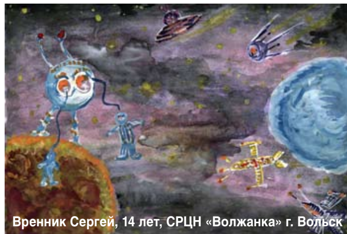
Вренник Сергей, 14 лет, СРЦН «Волжанка» г. Вольск

Почти двести рисунков поступило на конкурс! И это – весомое свидетельство приобщения подростков к духов-