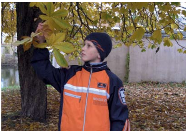
Одно из главных направлений деятельности центров «Семья» – работа с «трудными» подростками

■ В Балаковском центре помощи семье и детям «Семья» в течение летних каникул проводился конкурс «Образцовое поведение». В нем могли принять участие подростки в возрасте от 11 до 18 лет. Все они осуждены условно и состоят на учете в комиссии по делам несовершеннолетних. Конкурс проводился совместно с управлением по делам молодежи администрации города Балаково. Цель мероприятия – организация занятости подростков, профилактика безнадзорности и повторных преступлений. Участников конкурса жюри оценивало по нескольким критериям: наличие трудоустройства, отсутствие противоправных действий в течение лета, трудовые, спортивные, музыкальные и т.д. достижения, характеристика с места работы или из детско-оздоровительного лагеря. Финальный конкурс определил 16 победителей. Каждый победитель получил в подарок мяч и роликовые коньки.