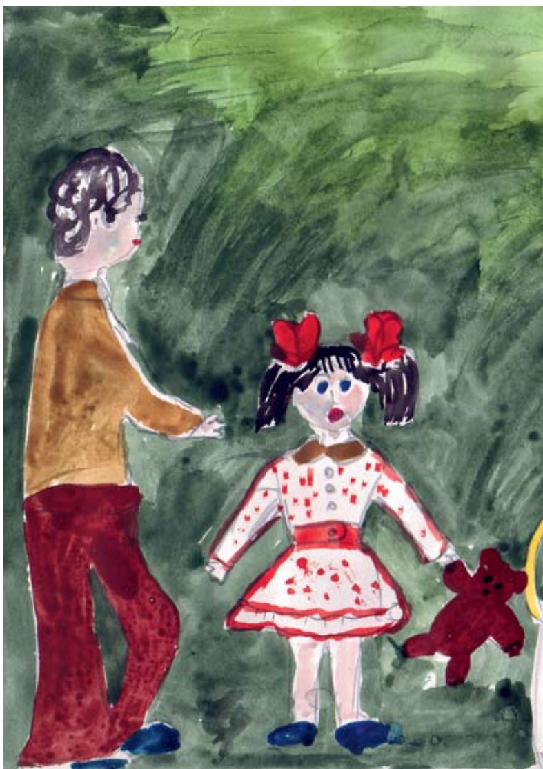
Я и мой папа

По результатам мониторинга у 89 процентов семей зарегистрирована положительная динамика развития внутрисемейных взаимоотношений.