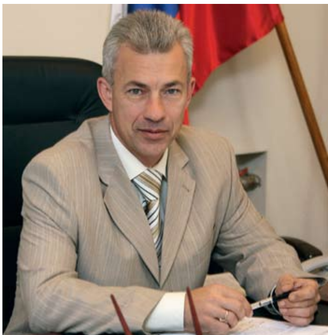
В. В. Чернышев, министр социального развития Саратовской области

СИСТЕМА СОЦИАЛЬНОЙ ЗАЩИТЫ НАСЕЛЕНИЯ САРАТОВСКОЙ ОБЛАСТИ В ПОСЛЕДНИЕ ГОДЫ ДИНАМИЧНО РАЗВИВАЕТСЯ. КОМПЛЕКСНО И ПОСЛЕДОВАТЕЛЬНО РЕШАЮТСЯ ТАКИЕ СОЦИАЛЬНЫЕ ПРОБЛЕМЫ ОБЩЕСТВА, КАК БЕДНОСТЬ, ОДИНОЧЕСТВО, СОЦИАЛЬНОЕ НЕБЛАГОПОЛУЧИЕ СЕМЬИ, ДЕТСКАЯ БЕЗНАДЗОРНОСТЬ, СОЦИАЛЬНАЯ ИСКЛЮЧЕННОСТЬ, ДЕЗАДАПТИРОВАННОСТЬ. ОБЕСПЕЧЕНО СВОЕВРЕМЕННОЕ И КАЧЕСТВЕННОЕ ПРЕДОСТАВЛЕНИЕ ГОСУДАРСТВЕННЫХ ГАРАНТИЙ И ДОСТУПНОСТЬ ВСЕХ ВИДОВ УСЛУГ В СФЕРЕ СОЦИАЛЬНОЙ ПОДДЕРЖКИ И СОЦИАЛЬНОГО ОБСЛУЖИВАНИЯ НАСЕЛЕНИЯ.