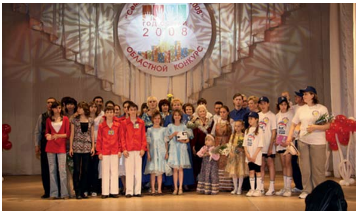
Победители и призеры областного конкурса «Семейный Олимп-2008»

Подведение итогов Года семьи, обсуждение задач и перспектив на будущее прошло в рамках проведения областного Гражданского форума.