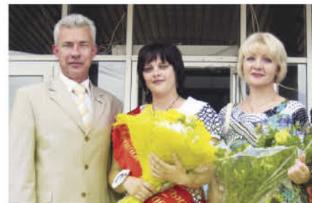
ник-2010» – самое яркое событие в моей трудовой биографии.

– Я хочу всем пожелать не бояться трудностей и участвовать в конкурсе. Я тоже боялась. Но благодаря поддержке коллег и близких, стала победителем. Теперь конкурс «Социальный работ-